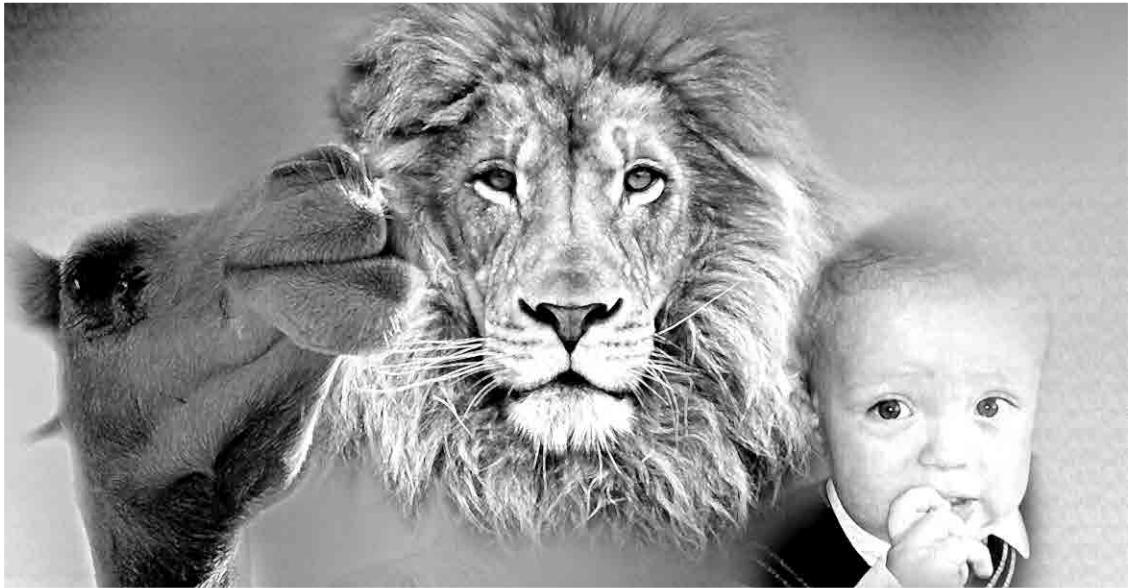
Nietzsche (Camello, León, Niño)