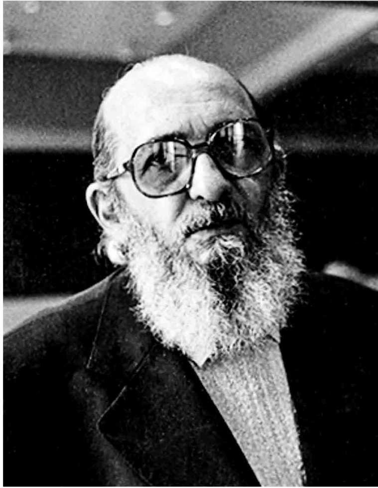
(Paulo Freire – Pedagogía crítica)