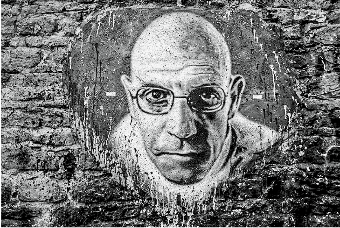
(Foucault – Análisis del poder)